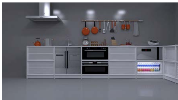
どこにでも設置できるキッチン