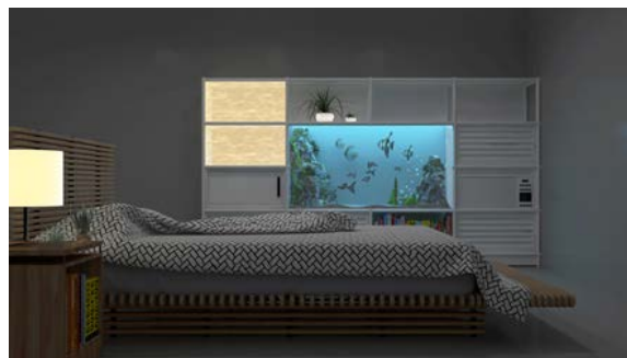
リラックスに寄り添うベッドルーム