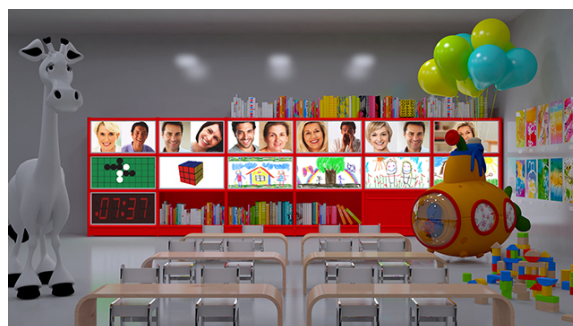
イマジネーションを具現化する学校