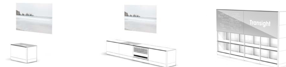
「Transight」構成ユニットイメージ

「Transight」をオープンプラットフォームとした他業種との協業を展開することで、家電やインテリアなどのハードと、ネットワークやコンテンツなどのソフトが融合された、新たなビジネスモデルを構築します。