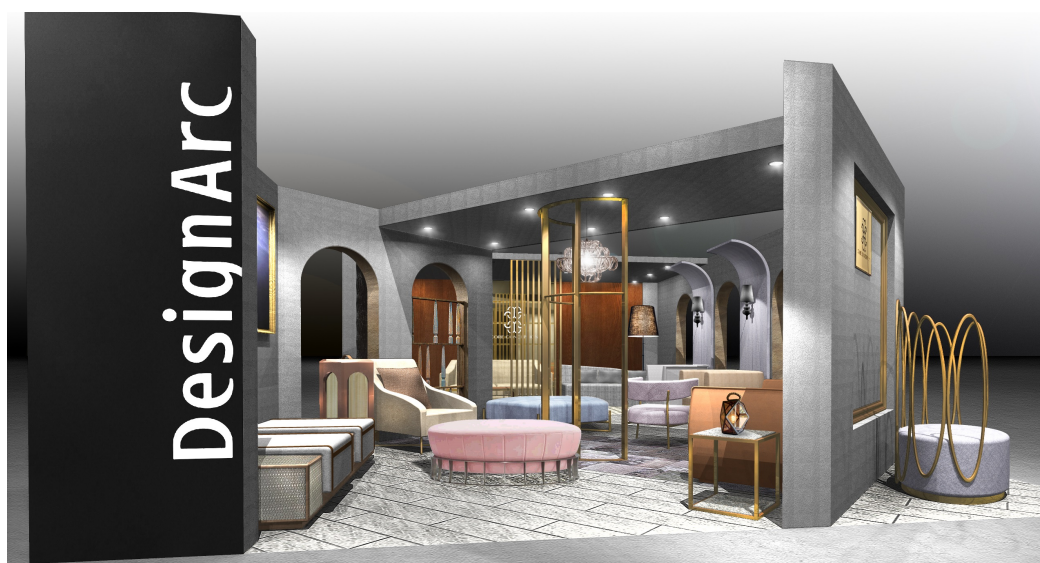
<ブース外観イメージ図>

ご多忙のところ誠に恐縮ではございますが、「CORE CONCEPTION」の世界観をブースにて、ぜひご体感いただきたくご案内申し上げます。