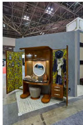
●ティアック製 WS-A70 が組み込まれたドレッサー

https://www.designarc.co.jp/divisions/works/360-panorama/hoterესjapan2019/