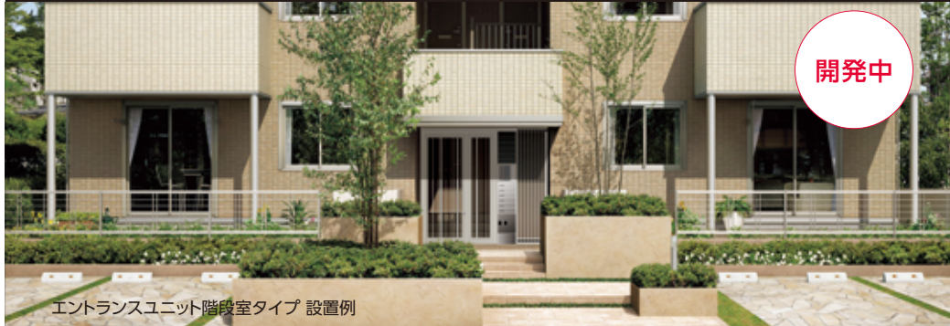
エントランスユニット階段室タイプ 設置例