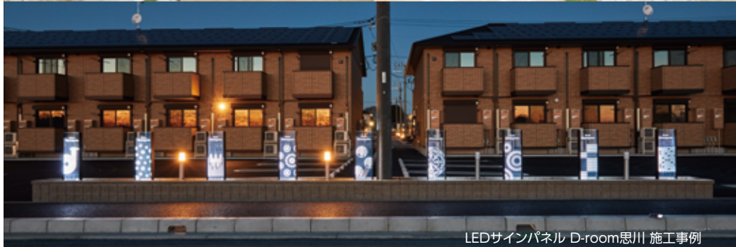
LEDサインパネル D-room思川 施工事例