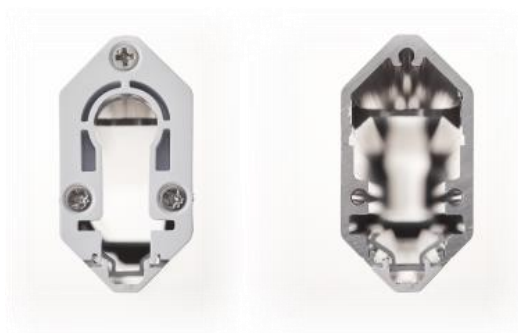
【八角形のフレーム断面形状】