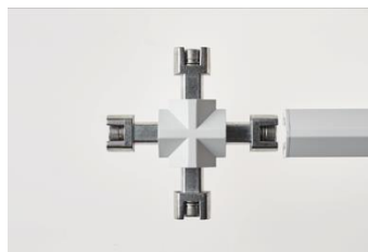
【ジョイント機構（特許出願中）】