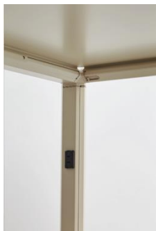
【コンセント付の縦型フレーム】

システム最大の特長は、電気工事士等の専門技術資格不要 ※7 でかつ、専用工具を使うことなく短時間で組み立てられる独自機構を開発し、搭載している点です。誰もが自由にレイアウトを柔軟に変更でき、コンセント付の縦型フレームを「Transight MS」の任意の縦列に配置して周辺機器の電源を取ることができます。